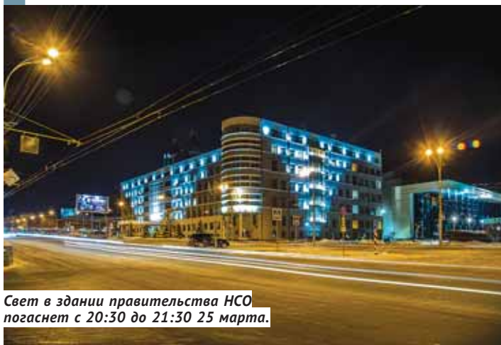
Свет в здании правительства НСО погаснет с 20:30 до 21:30 25 марта.

Обращение Министра природных ресурсов и экологии РФ Сергея Донского и представителей Всемирного фонда дикой природы (WWF) правительство Новосибирской области поддержит международную акцию «Час Земли». 25 марта, в субботу, на один час — с 20:30 до 21:30 — будет отключена по всему периметру подсветка на здании регионального правительства. Просьба поддержать акцию направлена в муниципальные образования и на крупные предприятия области, а также жителям региона — в знак неравнодушия к будущему планеты.