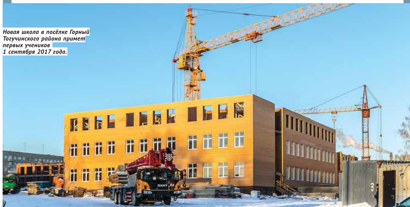
Новая школа в посёлке Горный Тогучинского района примет первых учеников 1 сентября 2017 года.

В декабре 2014 года Президент России Владимир Путин распорядился разработать программу, реализация которой позволит к 2025 году перевести все средние школы страны на обучение в одну смену. В конце 2015 года соответствующая программа по созданию новых мест в общеобразовательных организациях на территории Новосибирской области на 2016—2025 годы была утверждена на заседании регионального правительства.