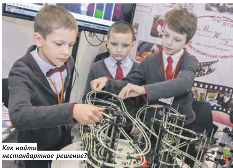
Как найти нестандартное решение?

Кстати, по итогам трёхдневного марафона победила Вторая Новосибирская гимназия — она и стала обладателем Кубка губернатора. Второе место заняла команда школы № 165 Новосибирска, третье и четвёртое место разделили технический лицей № 176 Карасукского района и новосибирская школа № 112. Победителей и призёров наградили медалями, сертификатами, путёвками на профильные смены в «Смену» и «Океан».