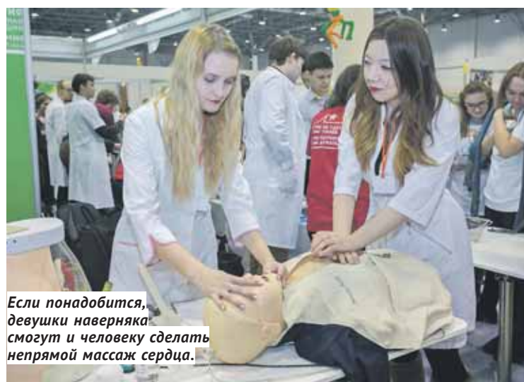
Если понадобится, девушки наверняка смогут и человеку сделать непрямой массаж сердца.

К аждый участник выставки старался показать свою изюминку. Ученики инженерного класса лицея № 176 (он специализируется на беспилотных летательных