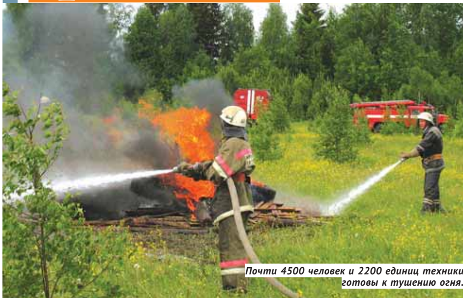
Почти 4500 человек и 2200 единиц техники готовы к тушению огня.

В минувший вторник, 21 марта, отмечался Международный день лесов, основной задачей которого является привлечение внимания к проблеме сохранности лесных насаждений. Работникам лесной сферы Новосибирской области, правда, сегодня не до праздников — конец марта традиционно самое ответственное время при подготовке к очередному пожароопасному периоду. Если весна, как обещают синоптики, будет ранней,