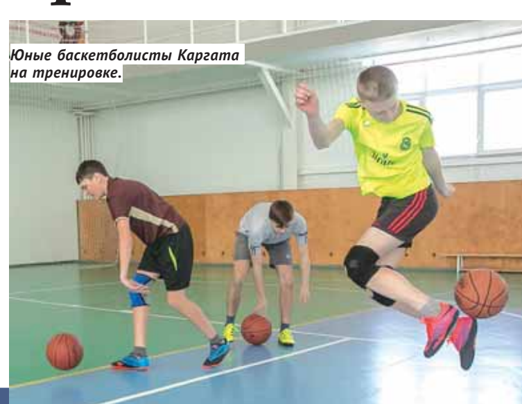
Юные баскетболисты Каргата на тренировке.

Страницу подготовила Татьяна МАЛКОВА