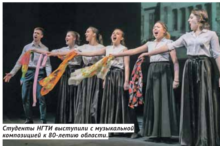
Студенты НГТИ выступили с музыкальной композицией к 80-летию области.

КОНКУРС В Новосибирске прошёл V Всероссийский конкурс исполнителей художественного слова.